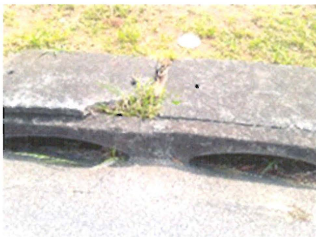
Tampa de bueiro quebrada