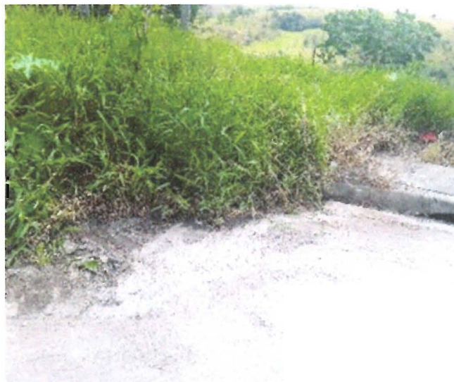
Mato avançando na rua