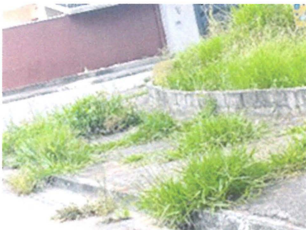
Capina e limpeza